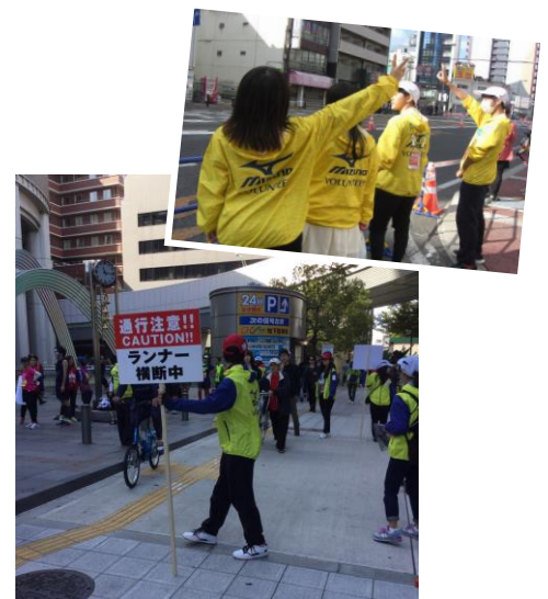
↑ 大阪マラソン通訳ボランティア