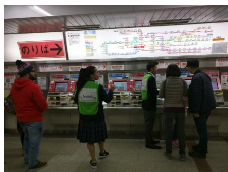
↑ 大阪 Metro 通訳ボランティア