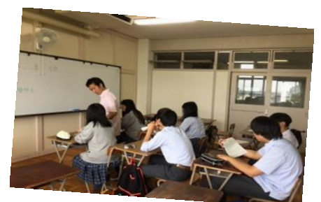
↑ 母語(中国語)の授業