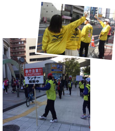
↑ 大阪マラソン通訳ボランティア