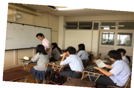
↑ 母語(中国語)の授業