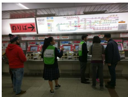
↑ 大阪 Metro 通訳ボランティア