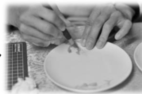
絵をつけたい場所に転写