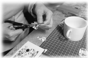
転写シートを切って…